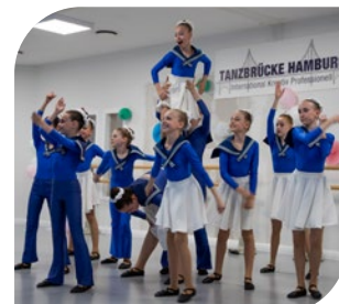
Tanzbrücke Hamburg e. V.

liche Chancen zu stärken. Der Zugang ist bewusst niedrigschwellig und inklusiv – im Mittelpunkt stehen Teilhabe, Förderung und gegenseitiger Respekt. Das Hamburger Spendenparlament unterstützte Tanzbrücke Hamburg e. V. mit einer Überbrückungshilfe von 27.600 Euro zur Abfederung gestiegener Mietkosten nach einem Umzug.