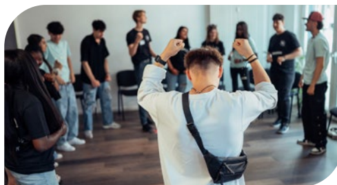
MUT Academy gGmbH

In Camps, Workshops, Bewerbungstrainings und Team-building-Formaten erwerben die Teilnehmenden fachliche und soziale Kompetenzen. Eine zentrale Rolle spielen die ehrenamtlichen MUTivator:innen, die Jugendliche individuell begleiten – vor, während und nach dem Einstieg in die Ausbildung. Die Erfolgsquote von rund 80 Prozent unterstreicht die Wirksamkeit des Ansatzes.