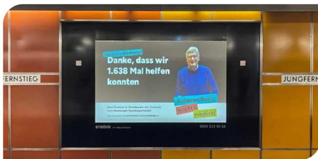
Starke Kampagne: Danke Ströer!